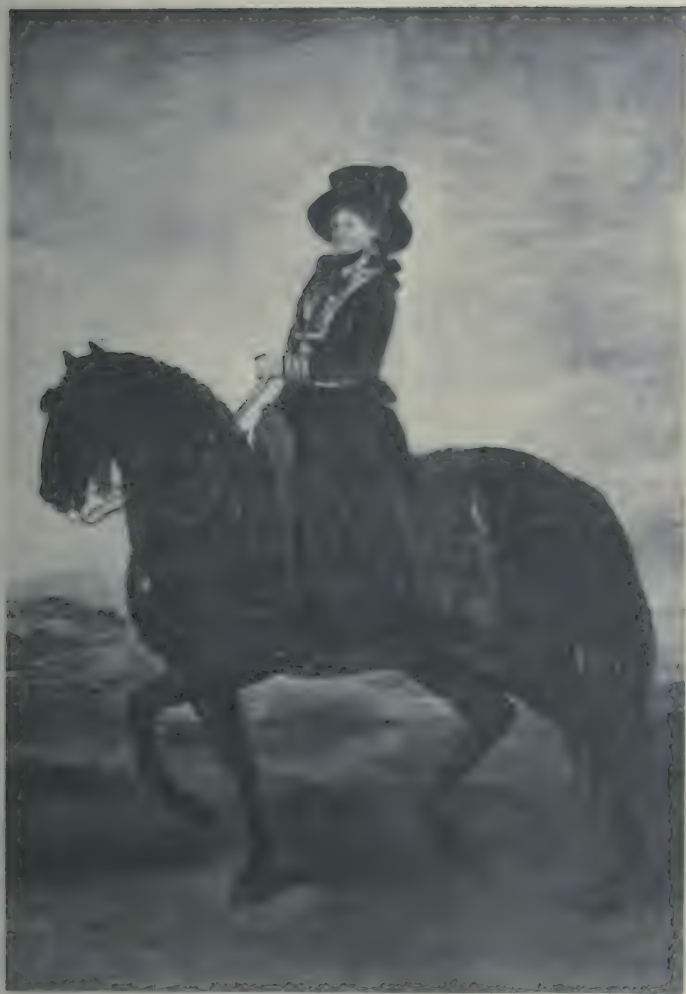
Marie-Louise de Parme, reine d'Espagne. Portrait de Francisco Goys. (Musée du Prado, à Madrid.)